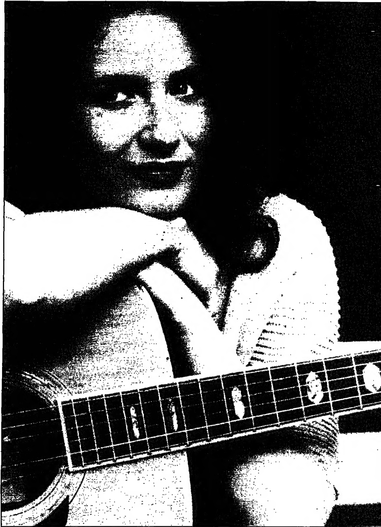
المغنية الفرنسية إلزا

■ وخلق حياتك وأب لويجي، بيشر كرونير، هل يشاركه المهام ذاتها في التربية؟